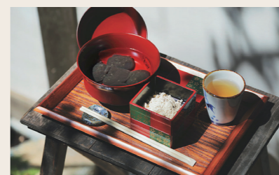
11 茶寮平野屋 和菓子+カフェ

営業時間: 10:00~15:00 定休日: 不定休 ※店休日はInstagramにてお知らせ 住所: 愛媛県大洲市大洲252