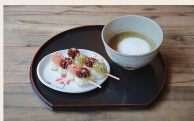
04 とうまん屋 和菓子+カフェ

営業時間: 11:00~16:00 定休日: 不定休 住所: 愛媛県大洲市大洲261 ※詳細はInstagramにて告知します