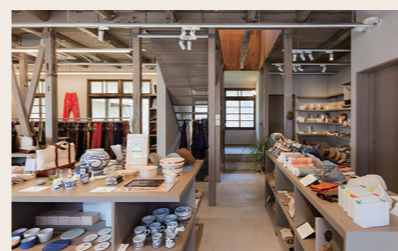
14 うなぎの寝床 クラフト雑貨

営業時間: 11:30~16:00 定休日: 火・水・木 住所: 愛媛県大洲市大洲392 ※祝日の場合は営業 ※中庭開放時間12:00~15:00 ※変更がある場合Instagramにて告知します