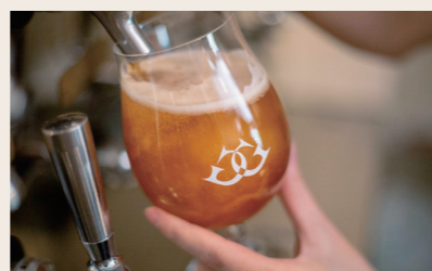
06 臥龍醸造 飲食(ビール)

営業時間: 11:30~18:00 LO17:30 定休日: 木・金・第三日曜日 住所: 愛媛県大洲市大洲31