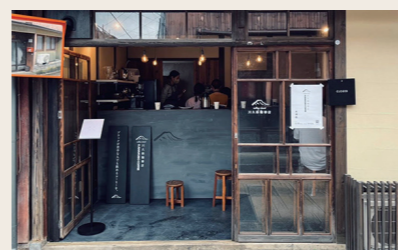
10 川久保珈琲 コーヒースタンド

営業時間: 11:00~18:00 定休日: 月・火・水 住所: 愛媛県大洲市大洲98-1 ※祝日の場合は営業、その他不定期の休業、年末年始等の長期休業あり ※詳細はInstagramにて告知します