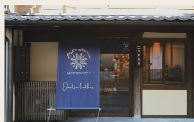
03 大松レザークラフト 革製品

営業時間: 11:00~16:00 定休日: 不定休 住所: 愛媛県大洲市大洲252