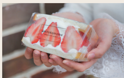
01 うみとカモメ 山下別邸 飲食 (フルーツサンド)

営業時間: 10:00~16:00 定休日: 月 住所: 愛媛県大洲市大洲252