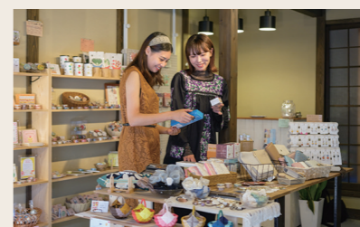
15 ヒタキの庭 雑貨

営業時間: 10:30~17:00 定休日: 火・水 住所: 愛媛県大洲市大洲240-2