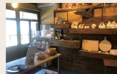
12 しずくや 土産+雑貨 +ジャムなどを使ったスイーツ

営業時間: 10:30~16:30 定休日: 火・水・木 住所: 愛媛県大洲市大洲394-1 ※祝日の場合は営業 ※毎月22日はお休み ※詳細はInstagramにて告知します