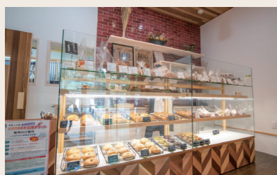
07 yumehonoka 飲食(パン)

営業時間: 10:00~16:00 定休日: 月・木 住所: 愛媛県大洲市大洲378