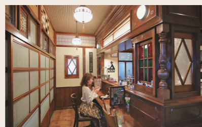
05 島田薬館カフェ随 カフェ(ランチ)

営業時間: 11:00~17:00 定休日: 水 住所: 愛媛県大洲市大洲263