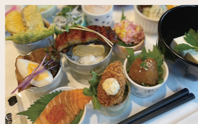
02 花とカフェ「レカン」 クレープ おちょこDONランチ

営業時間: 10:00~16:00 定休日: 月 住所: 愛媛県大洲市大洲252