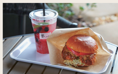
09 葵CAFE カフェ

営業時間: 10:00~17:00 定休日: 火・水 住所: 愛媛県大洲市大洲393