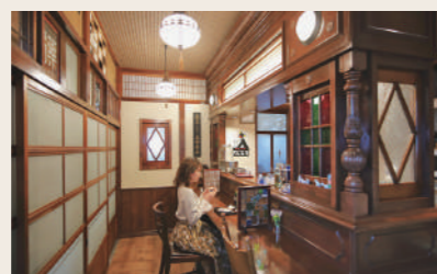
05 島田薬館カフェ随 まにまに カフェ(ランチ)

営業時間: 11:00~17:00 定休日: 水 住所: 愛媛県大洲市大洲263