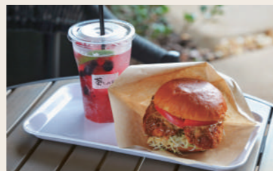
09 葵CAFE カフェ

営業時間: 10:00~17:00 定休日: 火・水 住所: 愛媛県大洲市大洲393