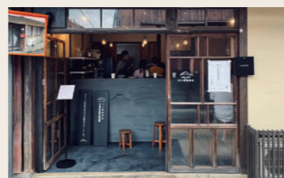
10 川久保珈琲 コーヒースタンド

営業時間: 11:00~18:00 定休日: 月・火・水 住所: 愛媛県大洲市大洲98-1 ※祝日の場合は営業、その他不定期の休業、年末年始等の長期休業あり ※詳細はInstagramにて告知します