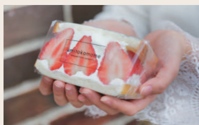
01 うみとカモメ 山下別邸 飲食 (フルーツサンド)

営業時間: 10:00~16:00 定休日: 月 住所: 愛媛県大洲市大洲252