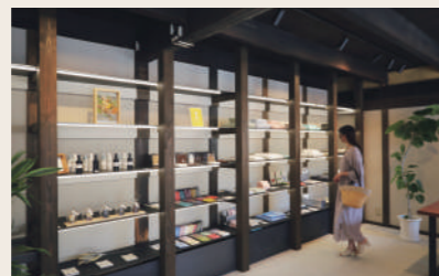
08 OZU+ 雑貨+タオル

営業時間: 10:00~17:00 定休日: 月・火・水 住所: 愛媛県大洲市大洲98-1 ※祝日の場合は営業、その他不定期の休業、年末年始等の長期休業あり ※詳細はInstagramにて告知します