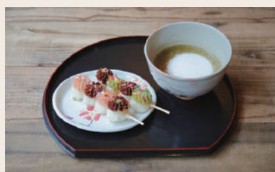
04 とうまん屋 和菓子+カフェ

営業時間: 11:00~16:00 定休日: 不定休 住所: 愛媛県大洲市大洲261 ※詳細はInstagramにて告知します