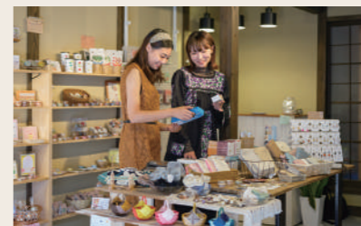
15 ヒタキの庭 雑貨

営業時間: 10:30~17:00 定休日: 火・水 住所: 愛媛県大洲市大洲240-2