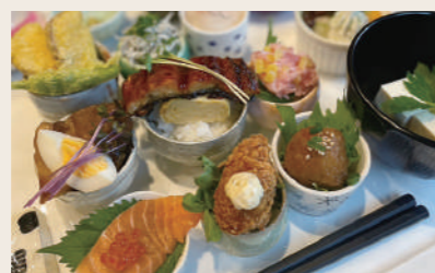
02 花とカフェ「レカン」 クレープ おちょこDONランチ

営業時間: 10:00~16:00 定休日: 月 住所: 愛媛県大洲市大洲252