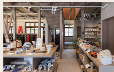
14 うなぎの寝床 クラフト雑貨

営業時間: 11:30~16:00 定休日: 火・水・木 住所: 愛媛県大洲市大洲392 ※祝日の場合は営業 ※中庭開放時間12:00~15:00 ※変更がある場合Instagramにて告知します