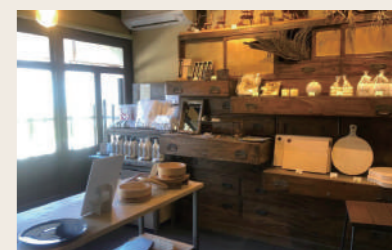
12 しずくや 土産+雑貨 +ジャムなどを使ったスイーツ

営業時間: 10:30~16:30 定休日: 火・水・木 住所: 愛媛県大洲市大洲394-1 ※祝日の場合は営業 ※毎月22日はお休み ※詳細はInstagramにて告知します