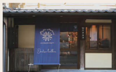
03 大松レザークラフト 革製品

営業時間: 11:00~16:00 定休日: 不定休 住所: 愛媛県大洲市大洲252