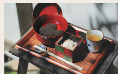
11 茶寮平野屋 和菓子+カフェ

営業時間: 10:00~15:00 定休日: 不定休 ※店休日はInstagramにてお知らせ 住所: 愛媛県大洲市大洲252